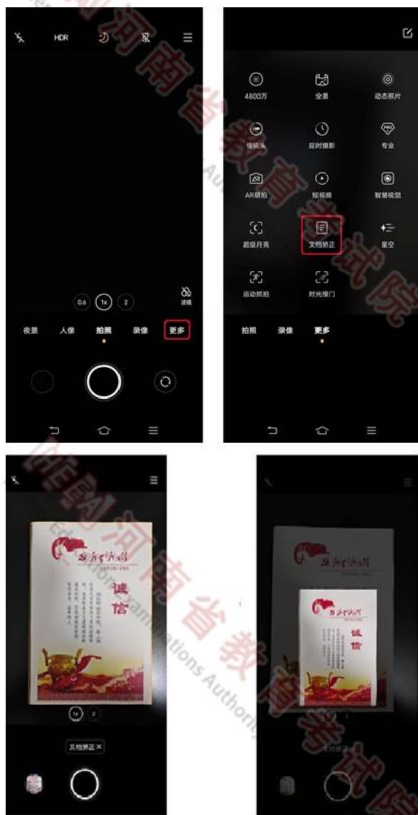
(二)使用第三方应用采集