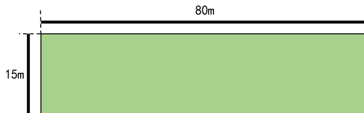
掷远与踢远场地示意图

如图 3 所示, 在球场适当位置画一条 15 米线段作为测试区横宽, 从横线两端分别向场内垂直画两条 80 米以上平行直线作为测试区纵长, 标出距离数。考生站在起点线后, 先将球以手掷远 3 次 (允许带手套进行), 然后用脚踢远 3 次 (采用踢凌空球、反弹球、定位球等方法不限), 各取其中最好一次成绩相加为最终成绩。每次掷、踢球的落点必须在测试区横宽以内, 否则不计成绩。