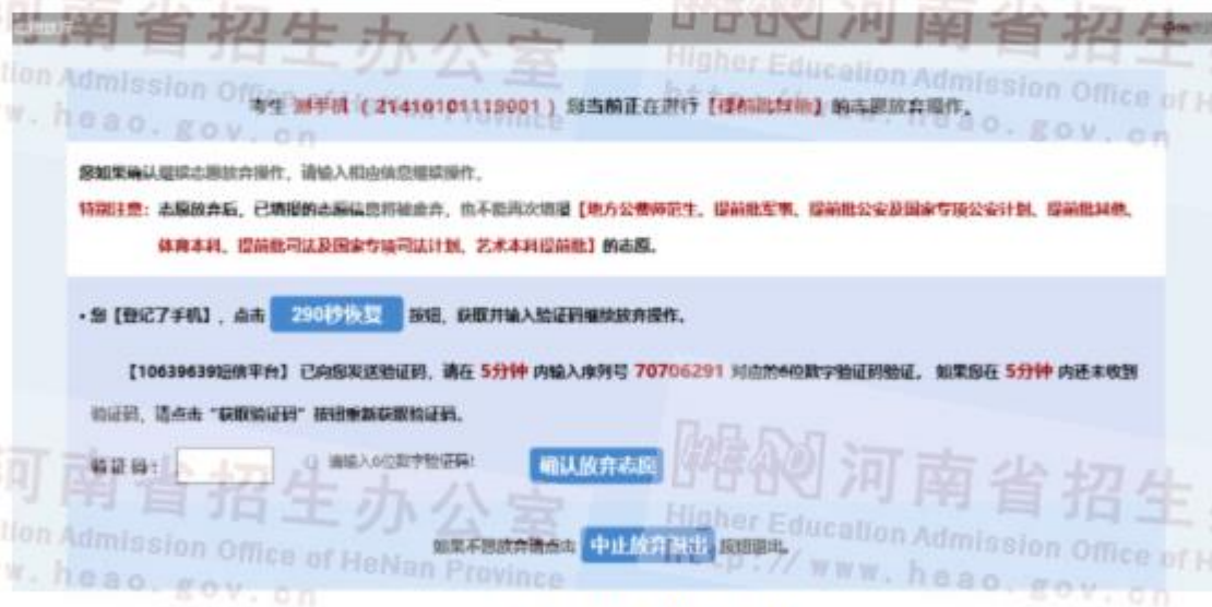
图 15 手机验证码有效期 5 分钟

普通类本科提前批、艺术提前本科批、体育类本科批共用一个“放弃志愿”按钮，一旦点击，则上述类别的这些批次全部放弃，不能再填报。艺术本科 A 段、本科 B 段同批次中平行志愿和顺序志愿共用一个“放弃按钮”，普通类专科提前批各类别、体育类专科、艺术类专科（美术和书法类）及艺术类专科（非美术和书法类）也是共用一个“放弃志愿”按钮，操作办法同上。放弃志愿操作界面也有相应的提醒。