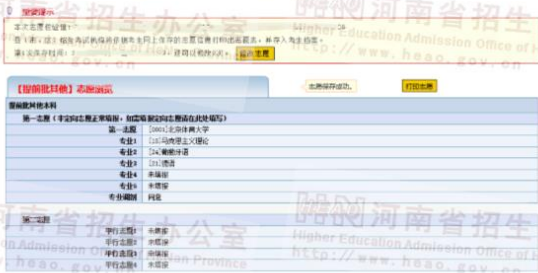
图 6 志愿浏览界面

5、志愿保存成功后，系统自动跳转到志愿信息浏览页面，显示考生已经填报的志愿信息，考生可以点击打印按钮打印志愿信息。