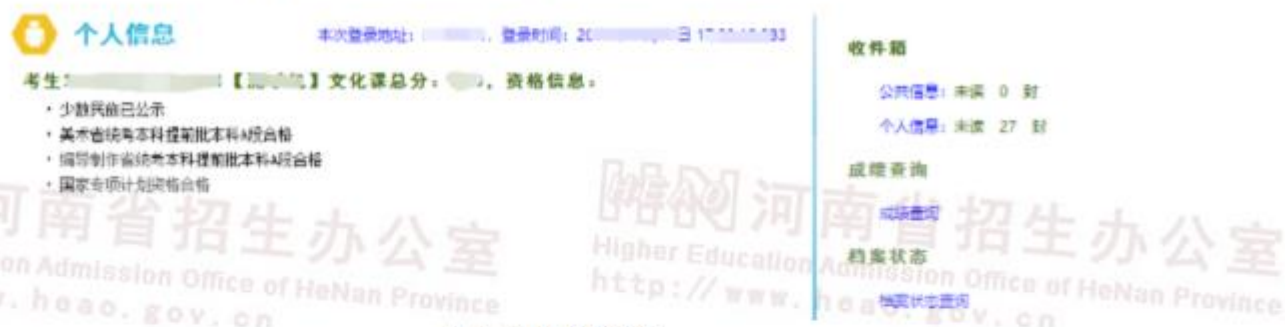
图 27 相关信息查看