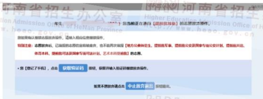
图 14 志愿放弃

普通类本科提前批、艺术提前本科批、体育类本科批共用一个“放弃志愿”按钮，一旦点击，则上述类别的这些批次全部放弃，不能再填报。艺术本科 A 段、本科 B 段同批次中平行志愿和顺序志愿共用一个“放弃按钮”，普通类专科提前批各类别、体育类专科、艺术类专科（美术和书法类）及艺术类专科（非美术和书法类）也是共用一个“放弃志愿”按钮，操作办法同上。放弃志愿操作界面也有相应的提醒。