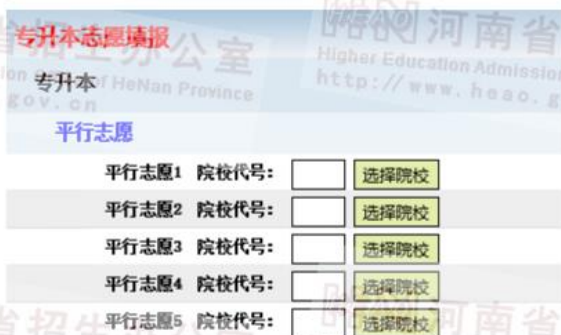
图 9 专升本志愿填报页面