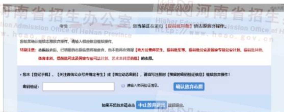
图 16 密码验证信息

如果考生绑定了动态密码，也可直接输入动态密码，进行验证。验证通过后，放弃操作成功，考生将不能再填报当前该批志愿。同时，系统会给考生发送放弃志愿的只读邮件提醒。