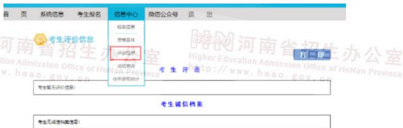
图 28 考生评价信息