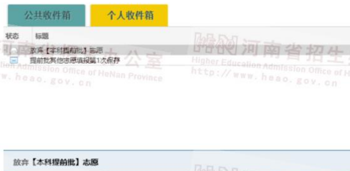
图 17 放弃志愿只读邮件

如果考生绑定了动态密码，也可直接输入动态密码，进行验证。验证通过后，放弃操作成功，考生将不能再填报当前该批志愿。同时，系统会给考生发送放弃志愿的只读邮件提醒。