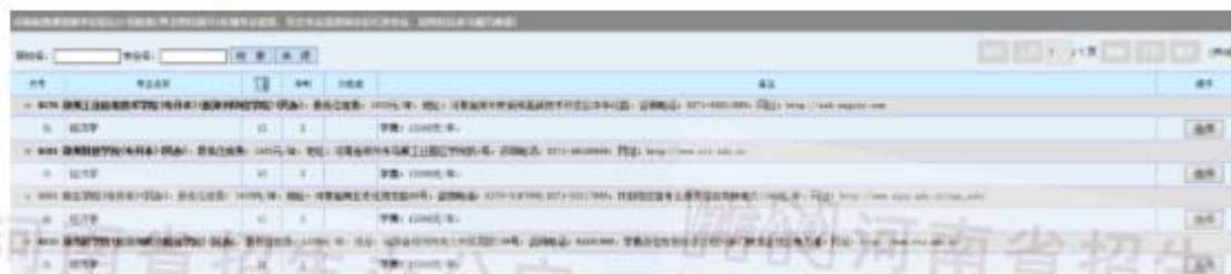
图 10 专升本计划查询页面

对于对口生，与专升本不同的地方时，除了选择院校外还需要选择专业和是否同意专业调剂，计划查询功能的使用方法是一样的。点击院校展开专业信息，然后双击专业或点击专业右侧的“选择”按钮即可选择相应的志愿信息。对口生的志愿的界面如下：